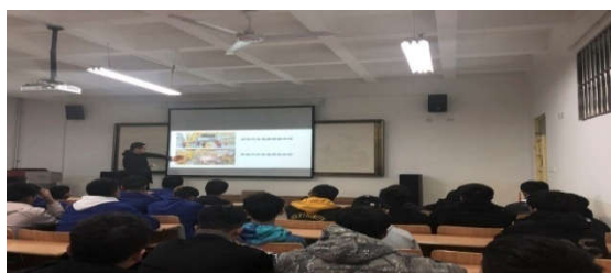
老师讲解汽车发展历史及生产车间现状