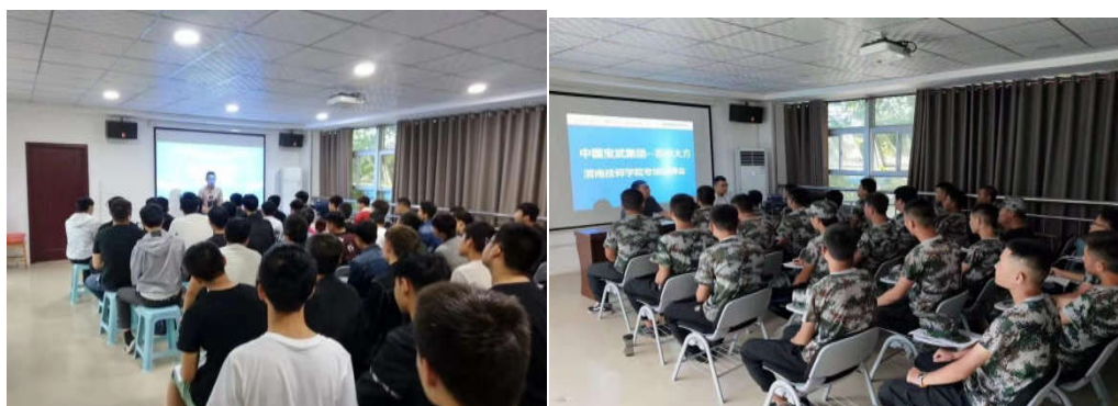
组织学生参加企业招聘报告会

(2) 利用报纸、网络、电视帮助学生了解当前的就业信息，有目的地组织学生参观招聘现场，开展模拟招聘活动，帮助学生掌握一些求职技巧，并通过一些成功的求职故事的介绍，使他们学习到一些与众不同的求职策略，提高求职成功率。