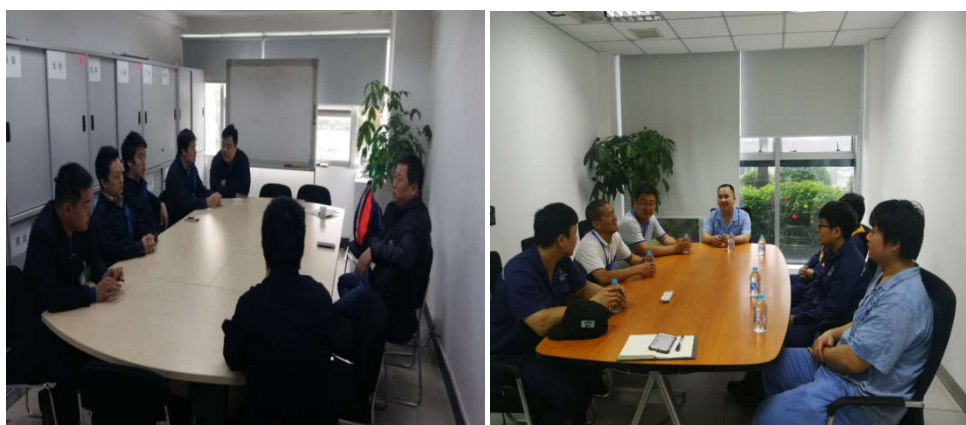
老师在企业进行实地调查

当前我国装备制造业普遍面临着“用工荒”的困境，通过对福建奔驰汽车有限公司，珠海格力电器股份有限公司等五家大中型企业学生顶岗实习及就业情况的了解，企业普遍反映中职院校毕业生稳定率比较低，经常出现随时离职的情况，守规矩、讲纪律、吃苦耐劳等方面还需要加强教育，最基本的职业素养需进一步提高。这些状况不仅制约了企业的人才储备和可持续发展，也不利于学生的职业发展。