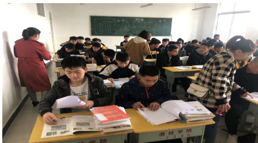
老师深入班级发放调查问卷

对汽车行业的了解情况、对理论课学习是否感兴趣、对职业生涯规划是否了解等十项内容进行。